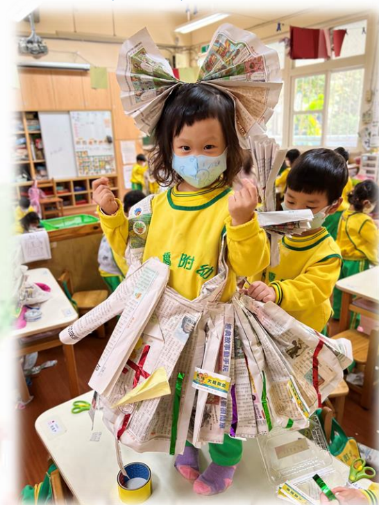
用紙替模特兒設計衣服