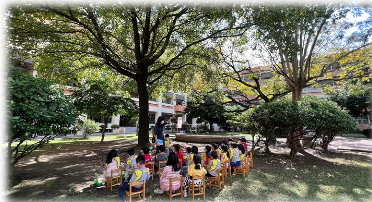
在中庭花園了解”樹”