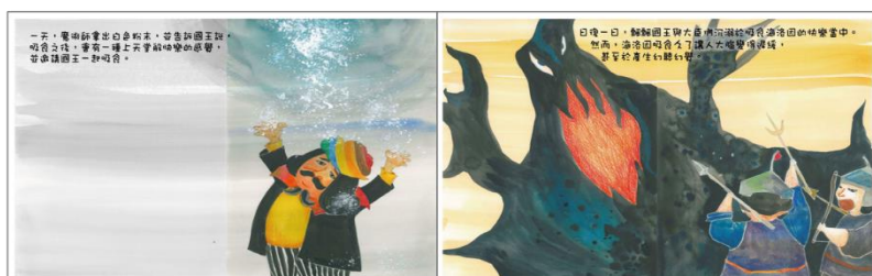
※範例作品：教育部反毒繪本—飄飄王國滅亡記/洪孟真、呂舒婷