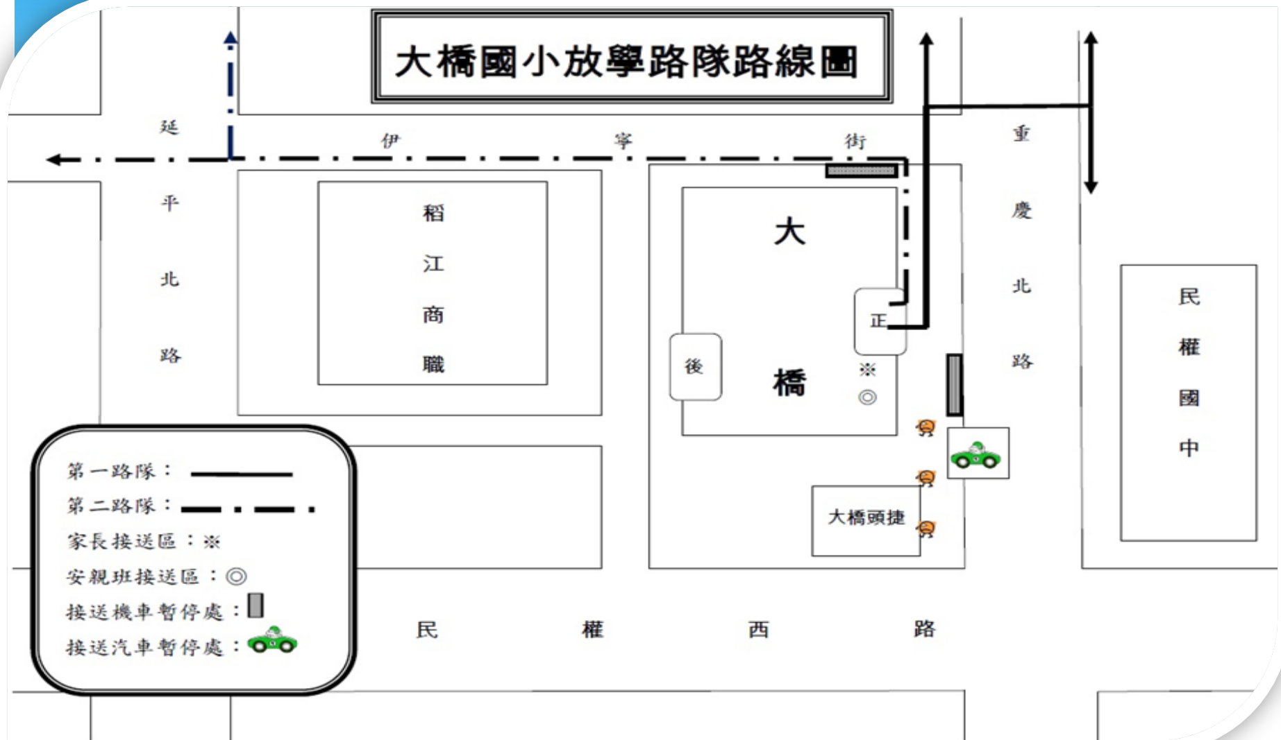
大橋國小放學路隊路線圖