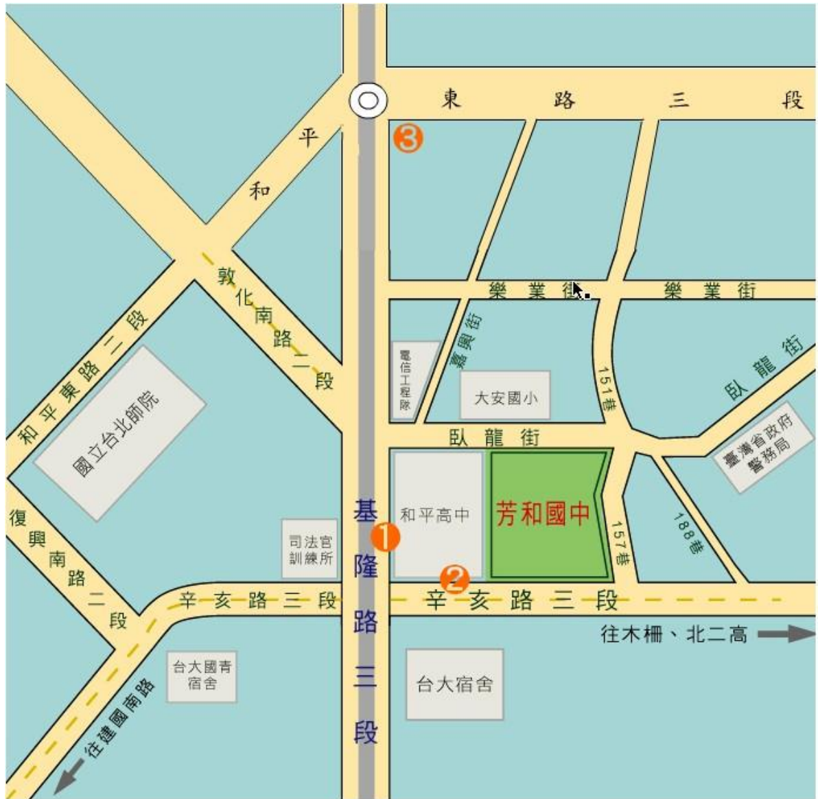
(四)芳和國中交通位置圖