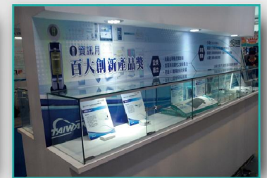
不定期海內外展示 透過不定期海內外展示，協助得獎產品推廣拓銷，並使得獎單位備感尊榮