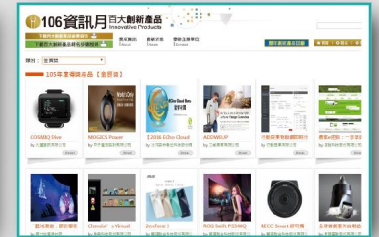
線上媒合平台網站宣傳 百大創新產品線上媒合平台，所有獲獎產品可無限期展示，隨時更新產品介紹