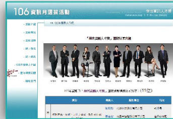
資訊月活動網站宣傳 透過資訊月網站專屬網頁宣傳得獎事蹟，提供得獎單位網頁連結