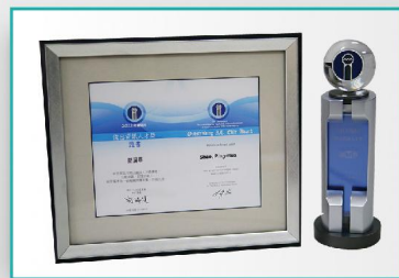
獎座及中英文證書 傑出資訊人才與百大創新金質獎頒發得獎獎座及中英文證書，象徵最高榮譽證明