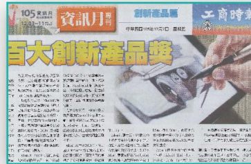
媒體專題報導 虛實媒體曝光宣傳