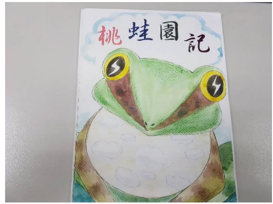
作品原稿(請勿書寫文字及頁碼)