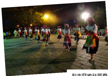
利吉惡地社區原住民熱舞迎賓。

此外，值此 0708 尼伯特颱風災害後各界關懷臺東之際，本活動不僅可深化全民對於國土永續管理之認同感，亦可喚起「擁抱臺東」的意識，展現對於大地的熱情，並對臺東地區觀光，促進地方經濟發展有所助益。