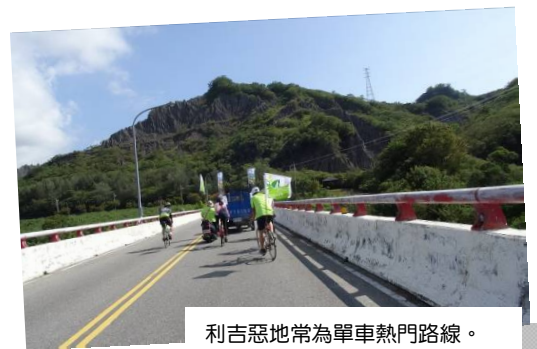
利吉惡地常為單車熱門路線。

相關訊息請見：地質知識網絡粉絲團 ( https://www.facebook.com/twgeoref )。